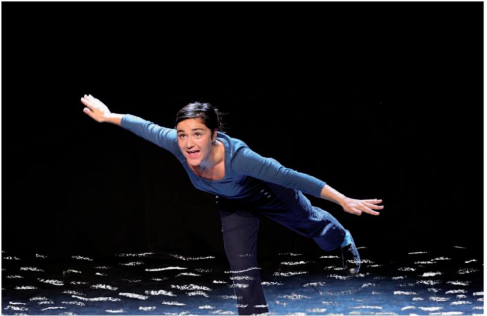
© R. Dupré & C. Voronkoff