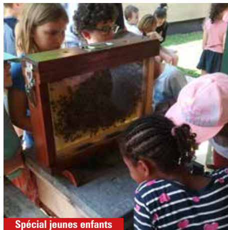
Spécial jeunes enfants

Dans un parc de 10 hectares aménagés et sécurisés pour le bien-être des jeunes. Beaucoup d'activités et un environnement idéal pour une colonie de vacances dynamique. Hébergement en chambres de 4, 6 et 8 lits, douches et sanitaires collectifs. Salle de restauration. Centre équestre, skatepark, piscine, parcours d'orientation, nombreux terrains : foot, rugby, basket, tennis, minigolf.