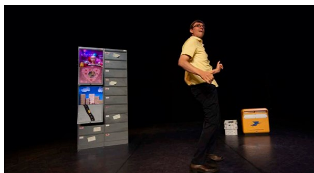
Photo : Spectacle Léon à venir

Ce spectacle conclura ainsi en beauté la saison 2023/2024 de Rêv'enScène, qui aura pu profiter à quasiment 9000 enfants landais, accueillis sur 10 spectacles soit 66 représentations, toujours dans la joie, la surprise et l'émerveillement que suscitent une sortie au spectacle !