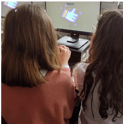
Sensibilisation des 5e sur l'usage d'Internet et des réseaux Sociaux

Utiliser VS Comprendre. Ces deux verbes révèlent des définitions bien différentes, et c'est également le cas quand nous parlons des réseaux sociaux. Qu'importe l'âge : paramétrer ses réseaux sociaux est pourtant primordial.