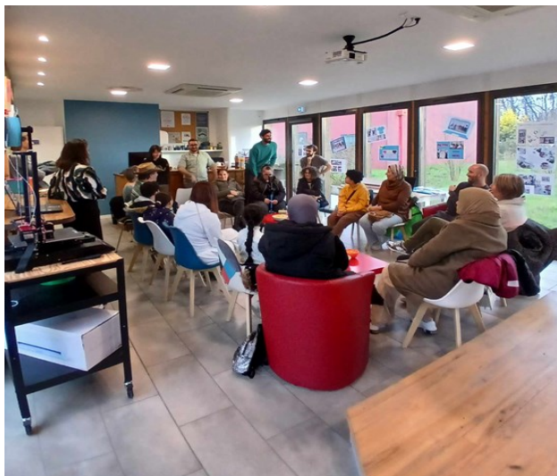
Photo : Soirée restitution au Tiers-Lieu CEP—Comptoir d'Education Populaire