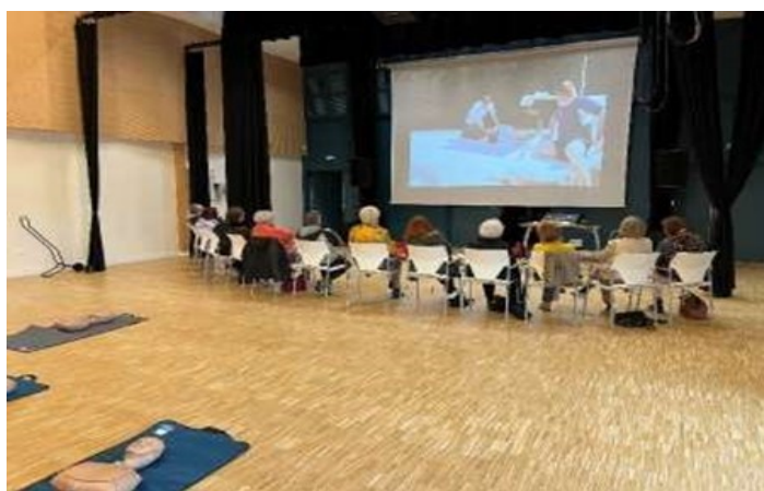
Formation secourisme séniors : théorie et pratique

Pour plus de renseignements n'hésitez pas à nous contacter par mail cd.40@ufolep.org ou au 05 58 06 31 32.