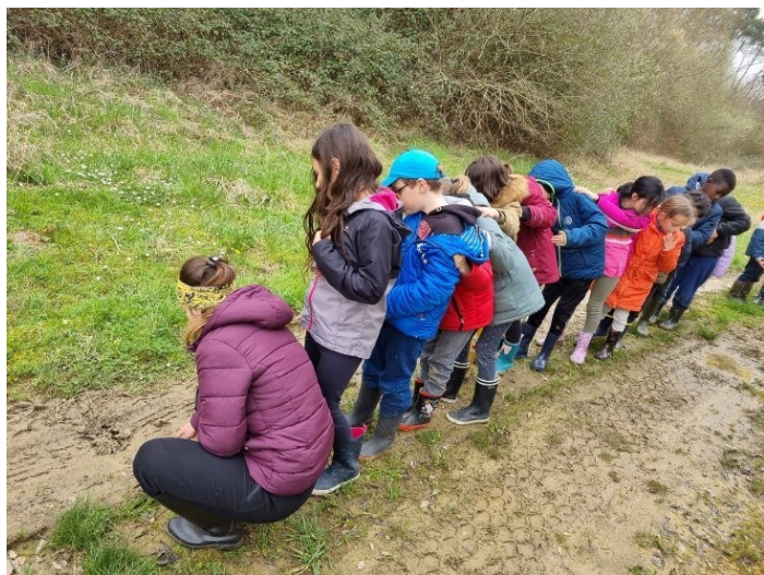
A Equiland, les enfants s'oxygènent et découvrent la nature !

Aujourd'hui plus que jamais où les liens sociaux se distendent faisant place à de l'individualisme, nous devons réaffirmer notre volonté de faire des classes de découvertes des espaces d'éducation au « vivre ensemble » dans l'objectif d'une transformation écologique et sociale. Le besoin de faire l'école ailleurs n'a jamais été aussi fort depuis l'après-covid, nous le constatons déjà dès cet automne avec des établissements scolaires venants des Pyrénées Atlantiques et de Gironde au Domaine Equiland à Cassen.