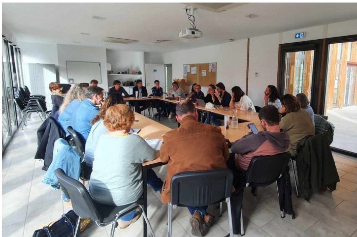
Le GEM en plein travail à la Ligue de l'Enseignement des Landes

où les personnes touchées par un TSA peuvent se soutenir mutuellement face aux difficultés qu'elles rencontrent, notamment en termes d'insertion sociale, professionnelle et citoyenne. Il vise ainsi à briser l'isolement qui peut peser sur ces personnes et leurs familles.