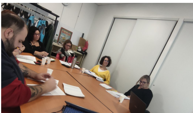
Les nouveaux Promeneurs du Net lors de leur formation du 7 novembre dernier

En ces temps où les Français passent de plus en plus de temps sur les réseaux sociaux, l'importance d'un tel dispositif de présence sur Internet est plus que nécessaire. Professionnels de la jeunesse ou du numérique, les Promeneurs du Net apportent une écoute active et un soutien