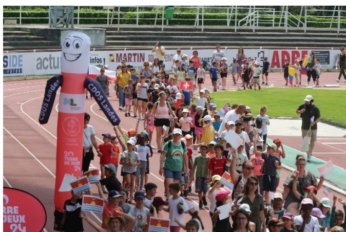
Une « Génération 2024 » prête pour les Jeux Olympiques !

L'échéance des Jeux Olympiques et Paralympiques (JOP) de Paris 2024 approche. Pour l'USEP, les Jeux ont même déjà commencé. Suite à la circulaire de rentrée, les associations d'écoles ont été invitées à évoluer dans une dynamique olympique tant par leur pratique sportive que dans la découverte et l'appropriation de la culture olympique. L'USEP des Landes préconise à ses associations d'organiser des rencontres sportives associatives dans le cadre de « Génération 2024 » tout au long de l'année ou de participer à des classes olympiques avec nuitées, notamment dans notre centre LEL de Cassen.