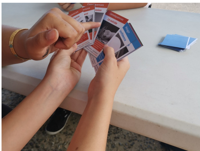
Des jeux au service de la sensibilisation et de la prévention.

Dans un monde en constante évolution, marqué par des inégalités croissantes, des tensions géopolitiques et des bouleversements climatiques, l'éducation à la citoyenneté est essentielle. C'est dans cette optique que la Ligue de l'Enseignement des Landes a lancé le "Parcours Citoyen 2023-24," comprenant des ateliers, des formations et des outils pédagogiques pour les élèves de l'école au lycée et la communauté éducative.