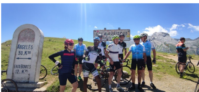
Sortie cyclo au Col d'Aubisque le 14/07/2023

Pour une meilleure visibilité du club, nous sommes présents au forum des associations et nous avons créé un compte Facebook : Cyclo Saint Jean d'Août .